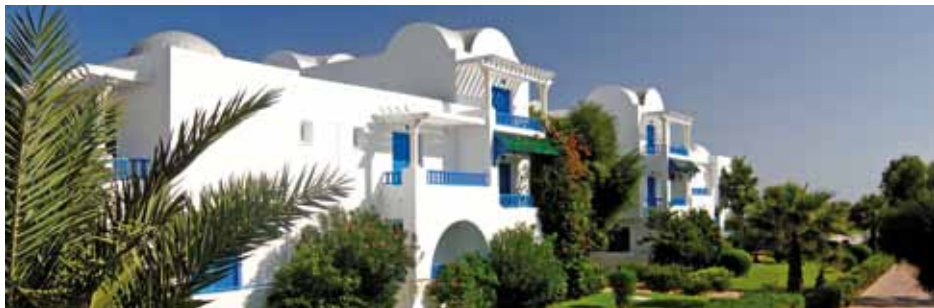
Jardins hôtel Salammbô

Massages, hammam, sauna, fitness, soins esthétiques, salon de coiffure et différents traitements. Différentes cures de 3 ou 6 jours sur demande.