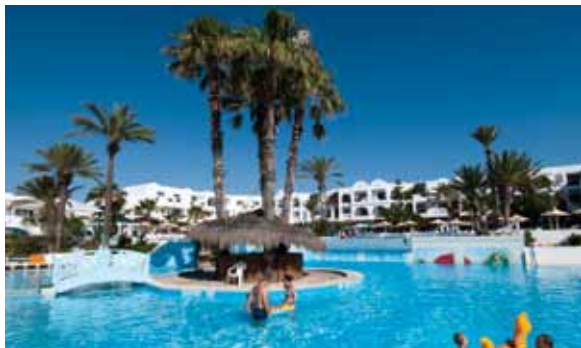
Piscine hôtel Aladin