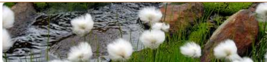
Cap Sud Voyages partenaire de "myclimate"