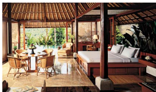
L'Amandari luxe & raffinement au cœur de Bali à proximité d'Ubud