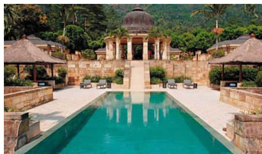
L'Amanjiwo, considéré comme l'un des plus bel hôtel du monde...