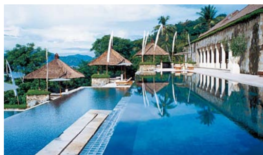
L'Amankila et ses piscines en cascades !